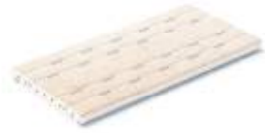
Rejilla de drenaje RJ25 · Drain grate RJ25