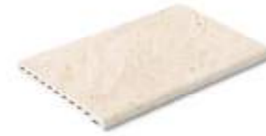
Borde Creta · Creta edge

↗ 33x50cm 13"x19.7" C3 R11 Coralina Aguada Coralina Samaná