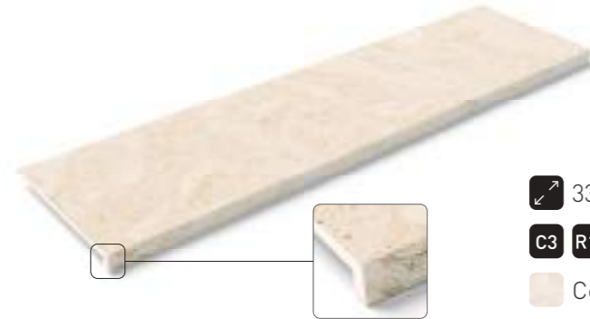
Peldaño recto · Recto step

↗ 33x120cm 13"x48" C3 R11 · C1 R9 Coralina Aguada Coralina Samaná