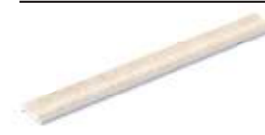
Media caña interior Inner trim