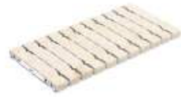
Rejilla de drenaje RJ25 FLEX · Drain grate RJ25 FLEX

Goma para rejilla 9710 incluida Grate rubber 9710 included