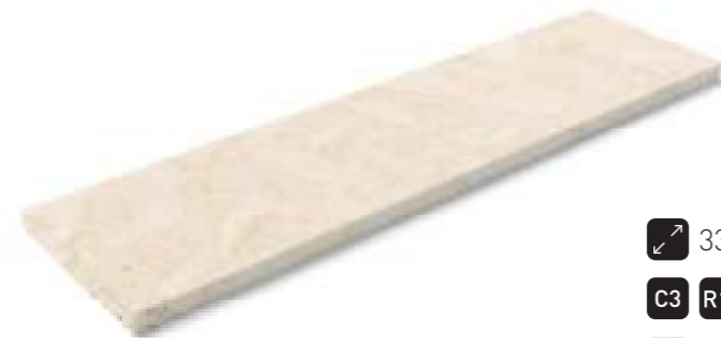
Peldaño recto tapa · Recto step corner

↗ 33x120cm 13"x48" C3 R11 · C1 R9 Coralina Aguada Coralina Samaná