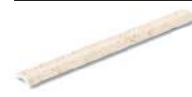
Media caña exterior Outer trim